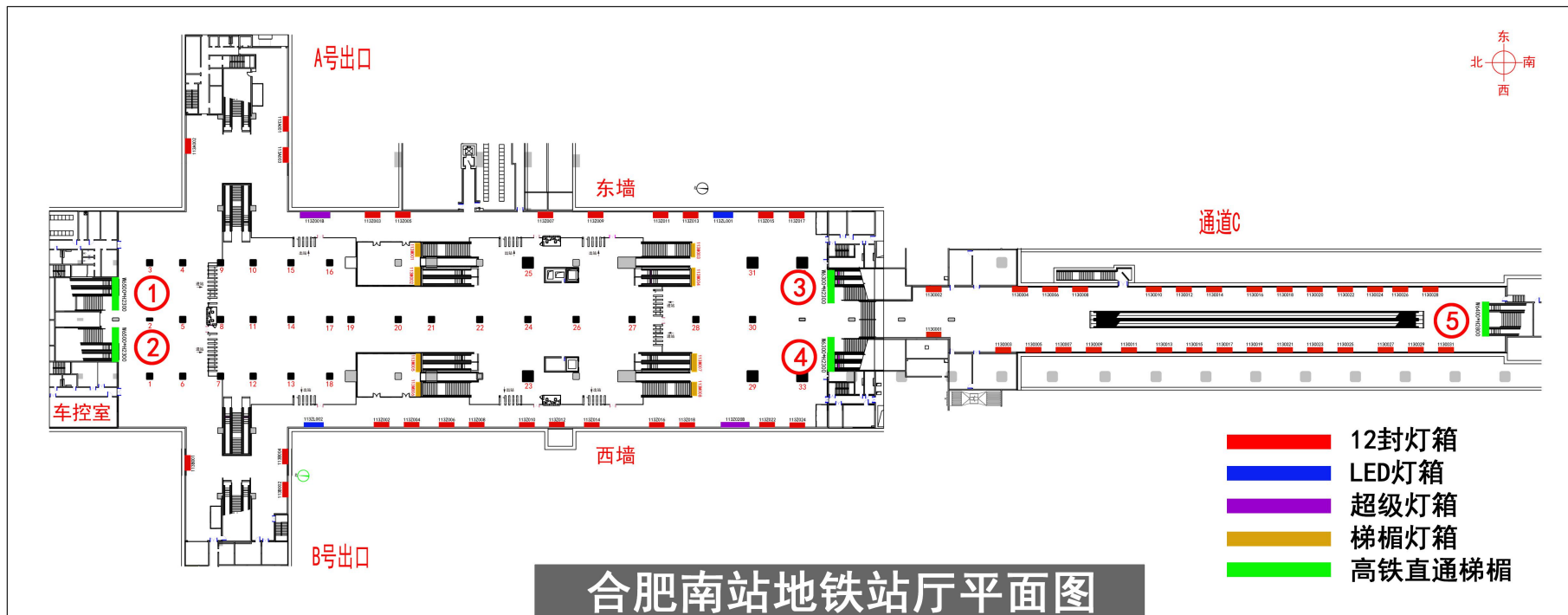
合肥南站地铁站厅平面图