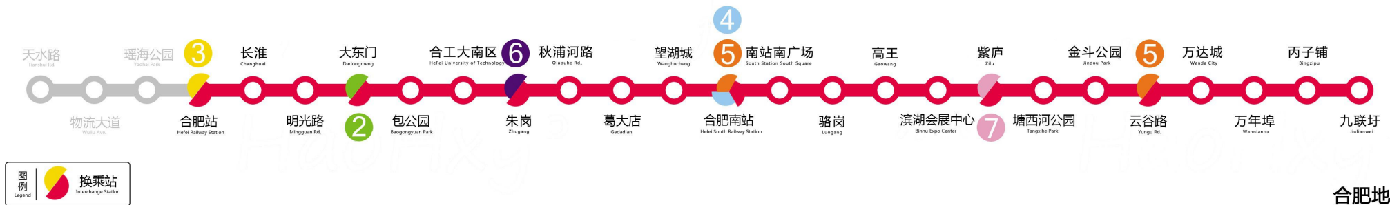
轨道交通1号线示意图